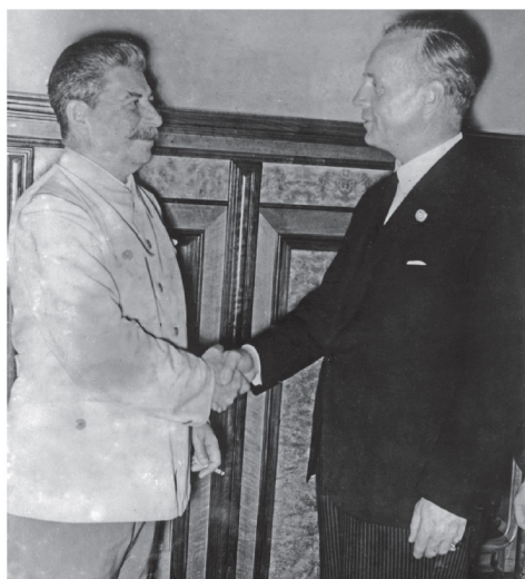
Stalin in nemški zunanji minister von Ribbentrop ob podpisu pogodbe v Moskvi