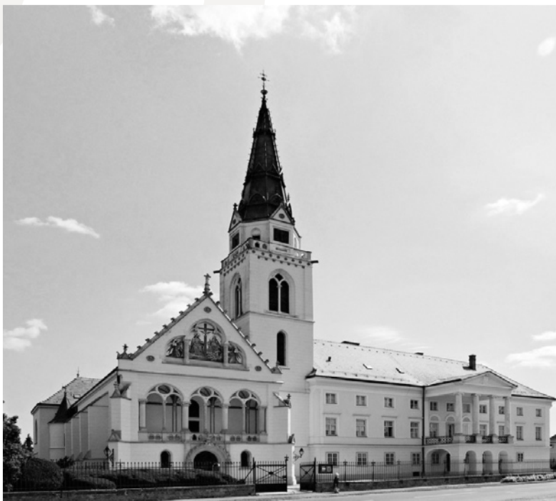
Grkokatoliška katedrala v Križevcih iz 19. stoletja.

Leta 2001 je bil osnovan apostolski eksarhat v Makedoniji, ki je postal avtonomna makedonska grkokatoliška Cerkev, čeprav podrejena latinskemu škofu v Skopju, in leta 2002 apostolski eksarhat za Srbijo in Črno goro. Pred letom 2001 je bila tudi Makedonija podrejena škofiji v Križevcih. Danes področje grkokatoliške škofije v Križevcih pokriva Hrvaško, Slovenijo ter Bosno in Hercegovino. Leta 2012 je zabeleženih 21.260 vernikov v 46 župnijah, 44 redovnic in 10 semeniščnikov. Dve župniji te Cerkve sta v Sloveniji in sicer v Metliki in Dragi z okoli 400 pripadniki etnično-verske skupnosti.